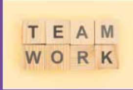
Konditionen für unsere Sevakas Seite 12