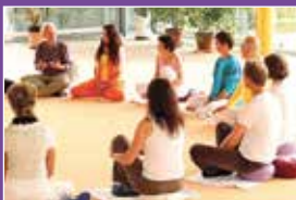
So wirst du Sevaka Seite 28