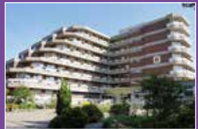
Ashram Bad Meinberg Seite 24