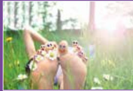
Wer sind wir? Seite 19