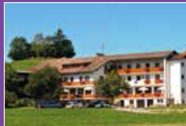
Ashram Allgäu Seite 26