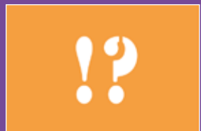
Wenn du mehr wissen willst!? Seite 31