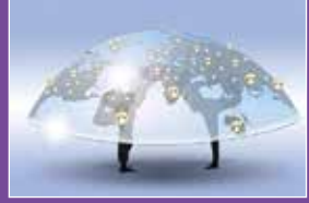
Grundlagen der Lebensgemeinschaft Seite 8