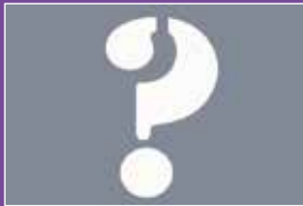
Wo kann ich Sevaka werden? Seite 22