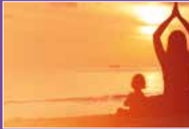
Ein typischer Tagesablauf Seite 16