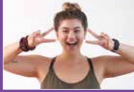
Sevaka Seite 6