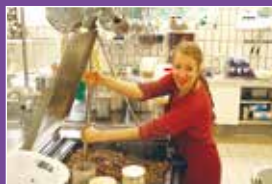
Ehrenamtliche Mithilfe Seite 29