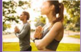
Wie lange wirst du Sevaka? Seite 14