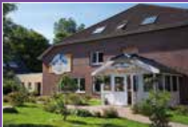
Ashram Nordsee Seite 25