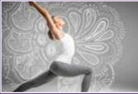
Leben und Mitwirken bei Yoga Vidya Seite 4