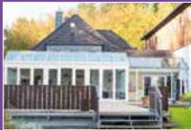
Ashram Westerwald Seite 23