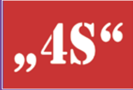
Grundprinzipien bei Yoga Vidya Seite 10