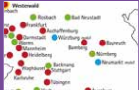
Yoga Vidya Center Seite 27